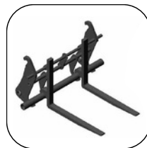
Horquillas para enganche rápido